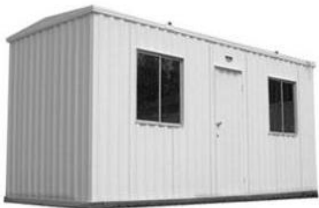
Medidas 6 x 2,5 x 2,7 h